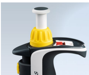
Technique Easy Calibration