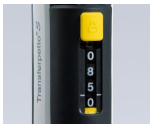
Protection du réglage de volume