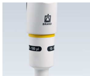
Connexion partie haute