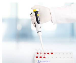
Préparation des échantillons