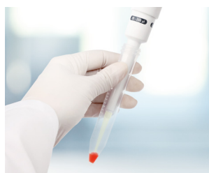
Tubes à centrifuger étroits