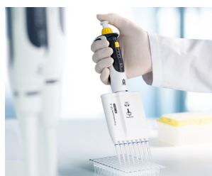
Travail avec des plaques PCR