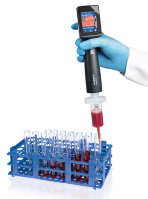
Dosificación secuencial con el HandyStep® touch S y punta PD-Tip //