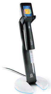
Soporte de carga con HandyStep® touch S y punta PD II