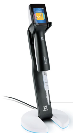
Soporte de carga con HandyStep® touch S y punta PD //

Botón STEP ubicado de manera ergonómica para aspirar y descargar el volumen sin esfuerzo