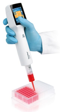
Dosificación múltiple con el HandyStep® touch y punta PD //

El HandyStep® touch ahorra tiempo y evita errores con el sistema de reconocimiento automático de las puntas PD // de BRAND con codificación patentada en el émbolo. Una vez colocadas, el tamaño detectado de la punta se muestra de forma automática. Así, el volumen que se desea dosificar se puede seleccionar de manera rápida y sencilla. Al colocar una punta PD // del mismo tamaño que la anterior, la configuración del dispositivo no se modifica.