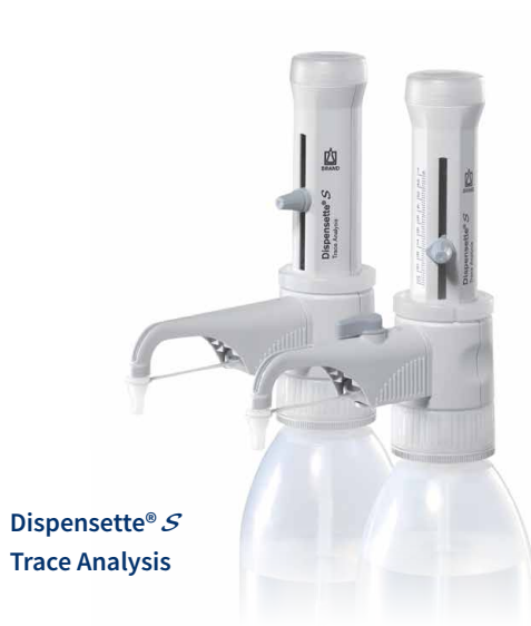
Dispensette® S Trace Analysis