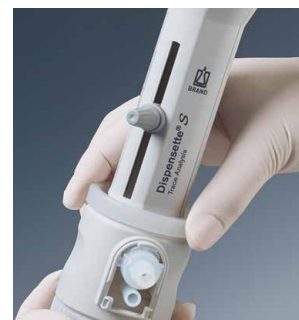
Sustitución sencilla y sin herramientas de la unidad de dosificación completa: la unidad de dosificación se suministra fija y correctamente ajustada.