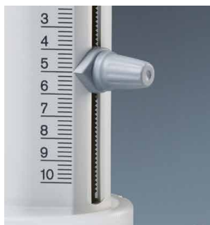
Fijación segura de volumen mediante regleta dentada situada en el interior