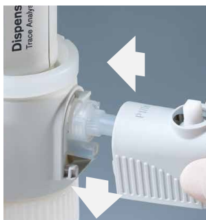
Montaje sencillo de la cánula de dosificación

Esta tabla ha sido comprobada cuidadosamente y se basa en los conocimientos actuales. Observar siempre las instrucciones de manejo del aparato y las indicaciones del fabricante de los reactivos. Si Ud. necesita informaciones sobre productos químicos no mencionados en esta lista, puede comunicarse con BRAND. Edición: 0815/2