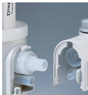
Sistema de válvulas, concebido sin juntas